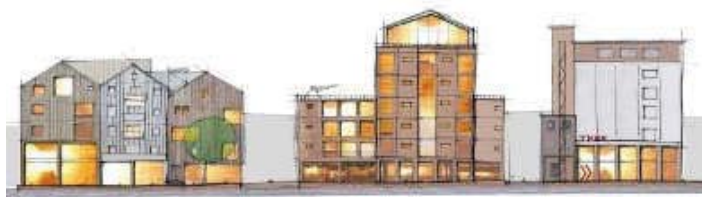
Voorbeeld woningen naast de graansilo

Hip wonen aan de historische haven van Assen. Met uitzicht op de markante graansilo. En 's zomers genieten van de reuring op het water en misschien wel een stadsstrand... Wie wil dat niet? Nu de woningbouw aantrekt, wil Assen werk maken van de omvorming van het verouderde Havenkwartier. Ook bij de eigenaren in het gebied trekt de animo aan voor woningbouwprojecten. Vier plekken in het Havenkwartier zijn daarvoor aangewezen. De gemeente richt zich nu eerst op het gebied rond de Havenkom; daar liggen de beste kansen. Het gaat om het gebied tussen C.T. Storkweg en de W.A. Scholtenstraat, zowel aan de zuid- als de noordkant van de haven.