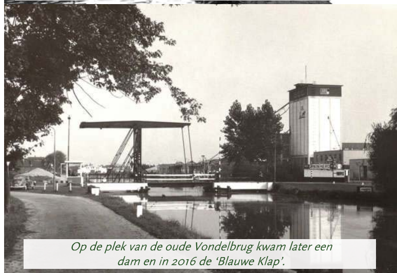
Op de plek van de oude Vondelbrug kwam later een dam en in 2016 de 'Blauwe Klap'.