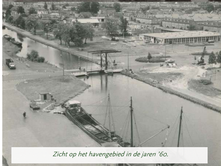
Zicht op het havengebied in de jaren '60.