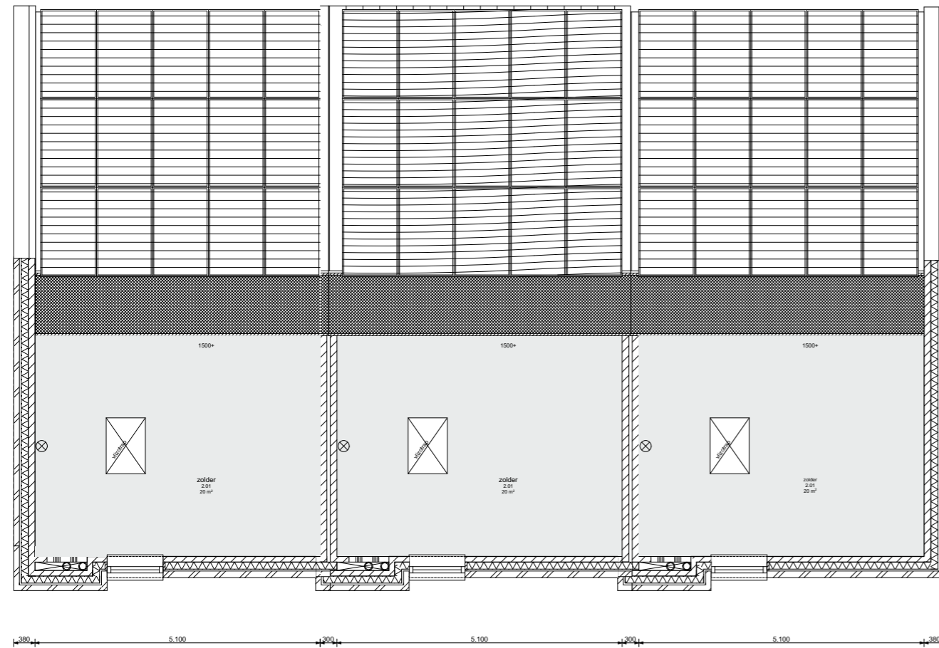
Eindwoning rechts - type A, B en C