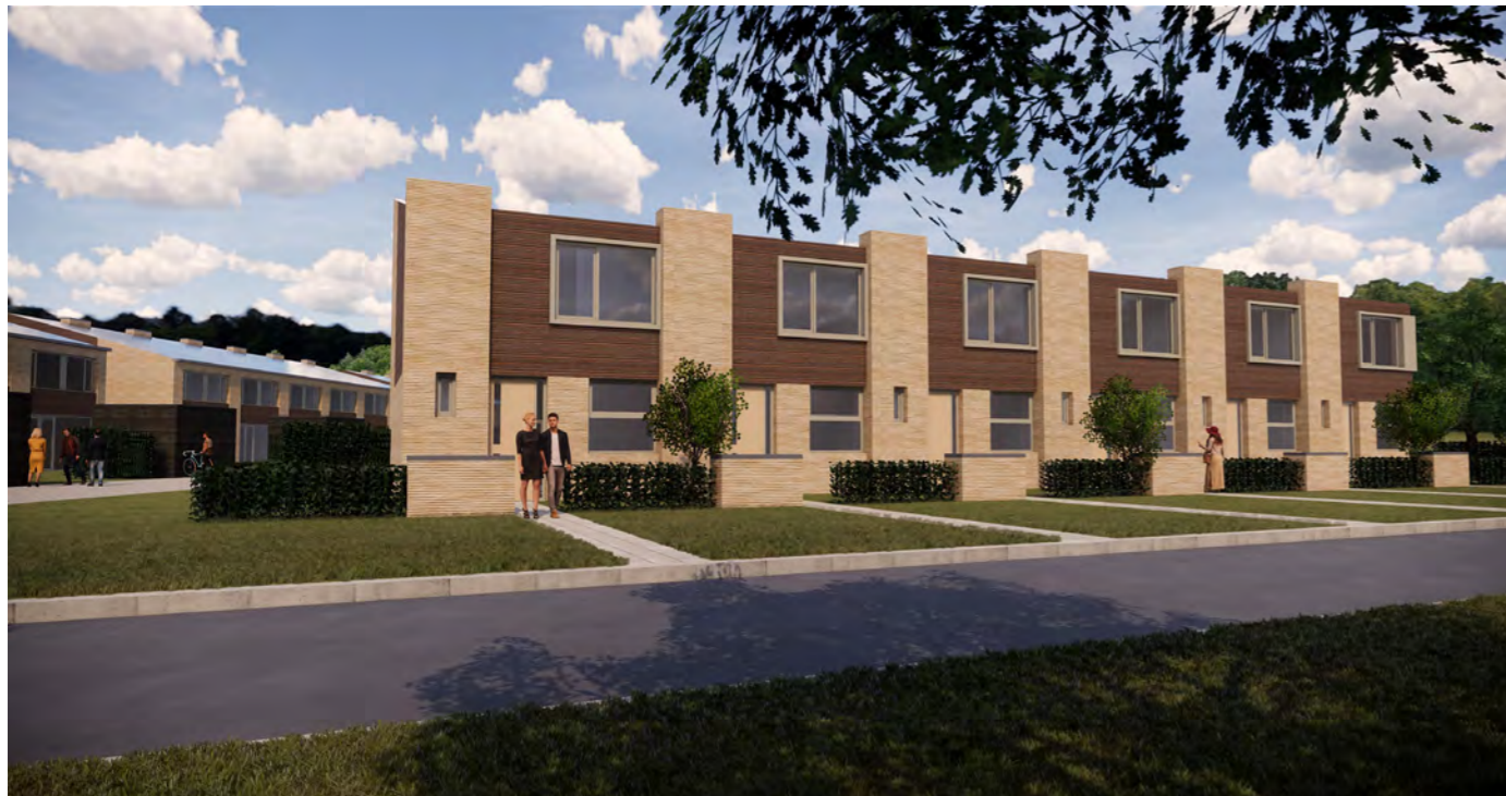
Voorzijde woning Type C 1 t/m 6