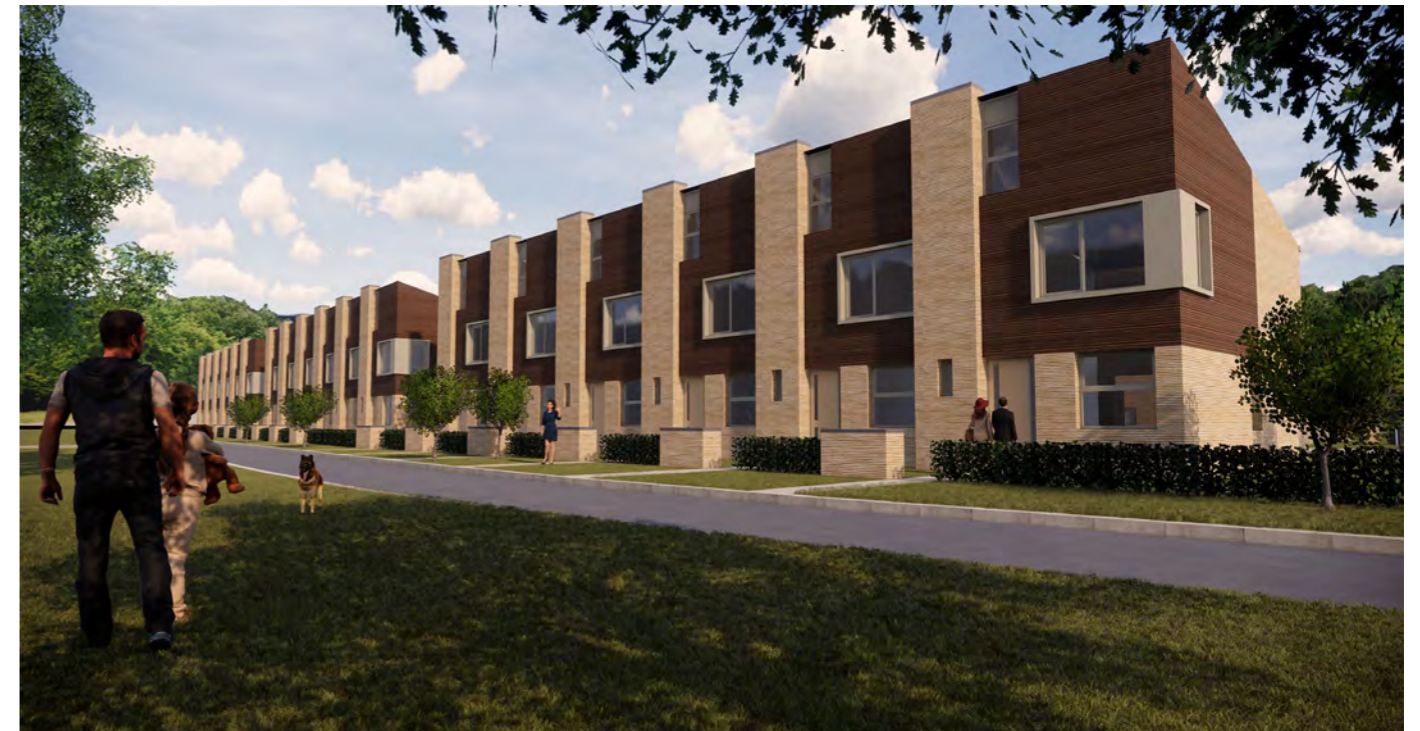
Voorzijde woning Type B 7 t/m 24 / woning Type A 25 & 26 (eindwoningen)