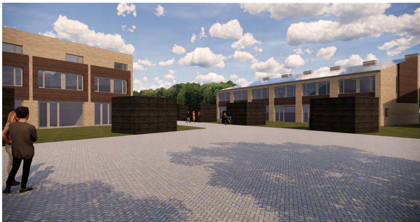
Achterzijde woning Type B