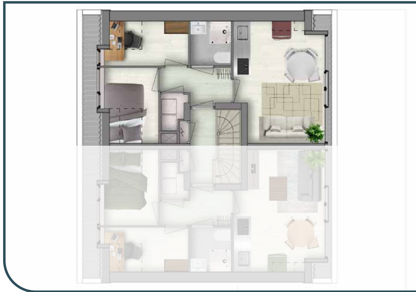
TWEEDE VERDIEPING APPARTEMENT 4