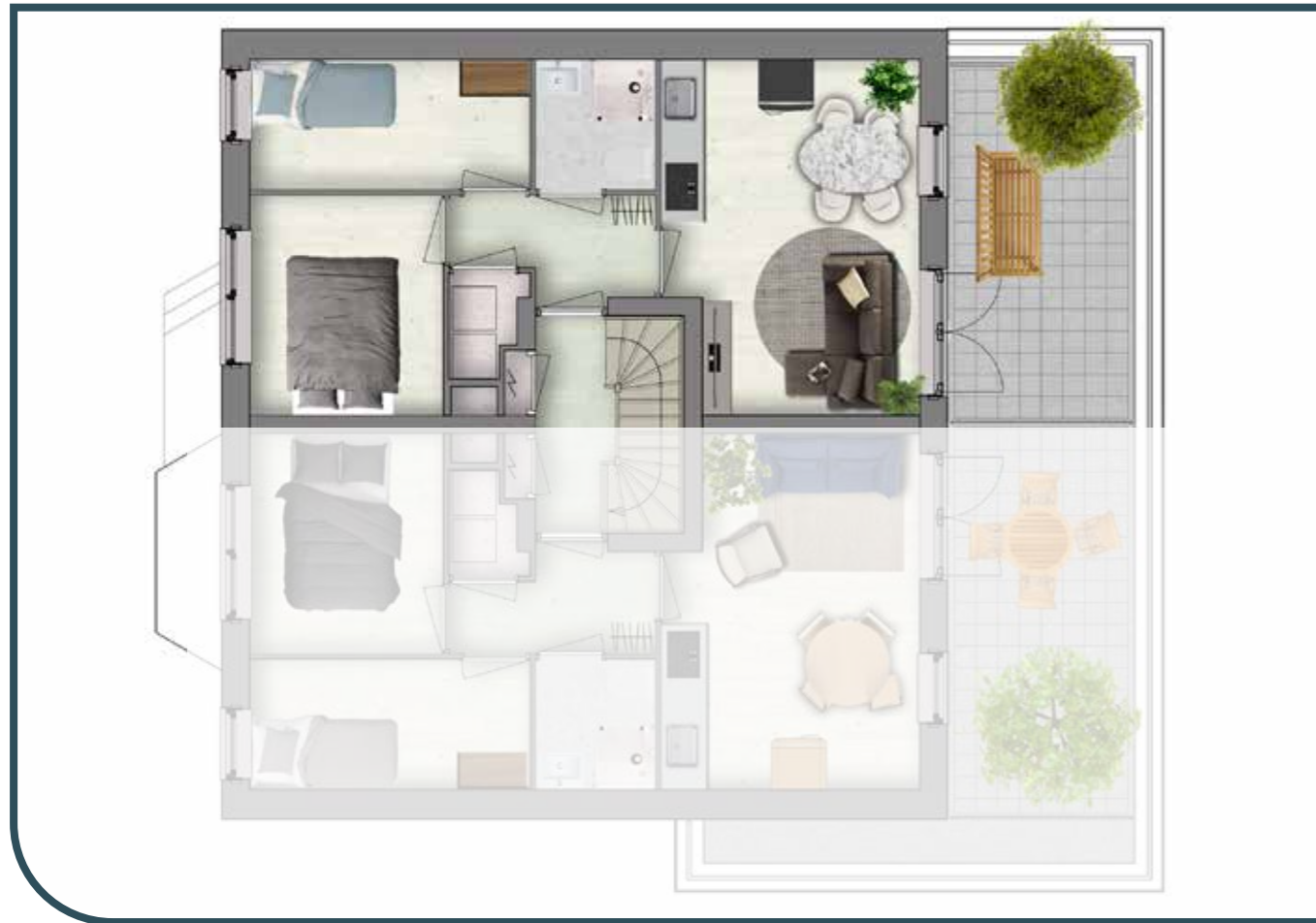
EERSTE VERDIEPING APPARTEMENT 2