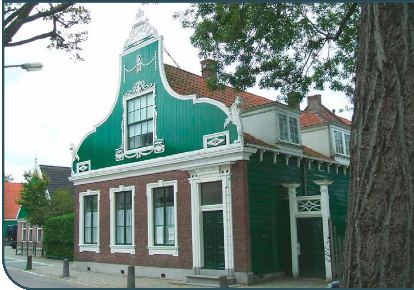
OUD KATHOLIEK PAROCHIEKERKJE