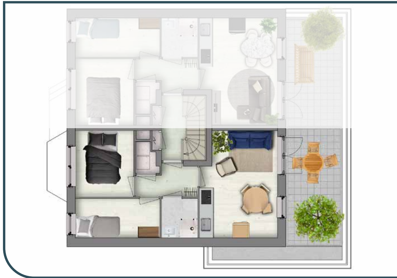
EERSTE VERDIEPING APPARTEMENT 3