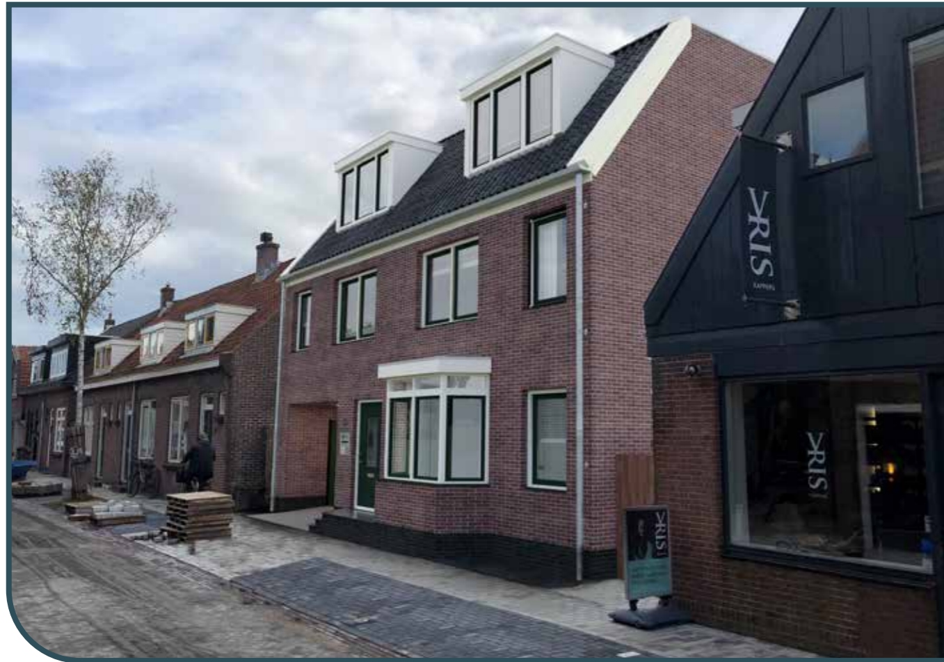
IMPRESSIE EXTERIEUR VOORZIJDE