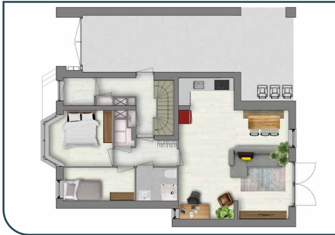
BEGANE GROND APPARTEMENT 1