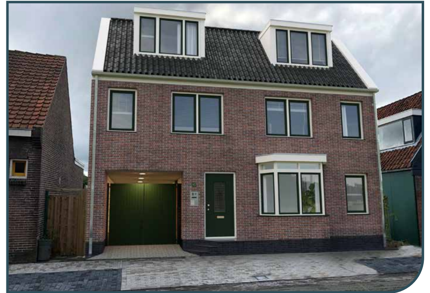
IMPRESSIE EXTERIEUR VOORZIJDE