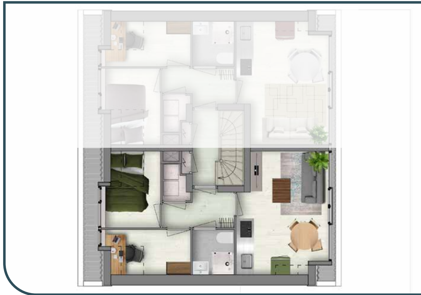
TWEEDE VERDIEPING APPARTEMENT 5