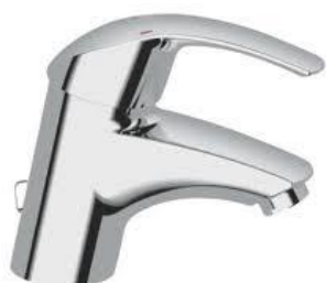
Wastafelmengkraan Grohe Eurosmart