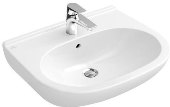
Villeroy en Boch O Novo wastafel Afmeting: 60 x 49 cm