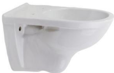
Wandcloset Villeroy & Boch O.Novo diepspoel, kleur: wit