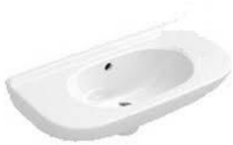
Fontein Villeroy & Boch O.Novo wit