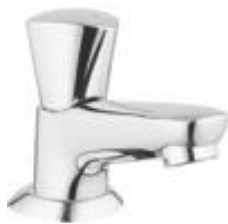
Fonteinkraan Grohe Costa-S (standaard)