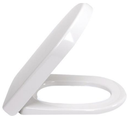
Villeroy & Boch O.Novo closetzitting met deksel