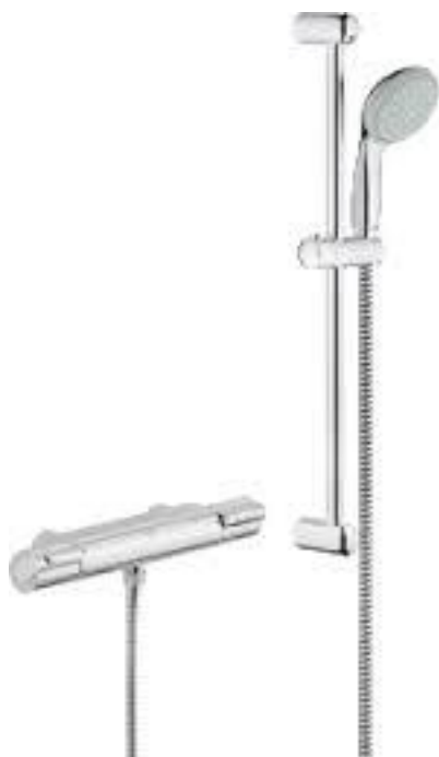
Grohe Grohtherm 1000 New thermostatische douchemengkraan met glijstang 60cm