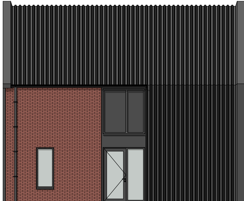
Rechtergevel NR5 G4