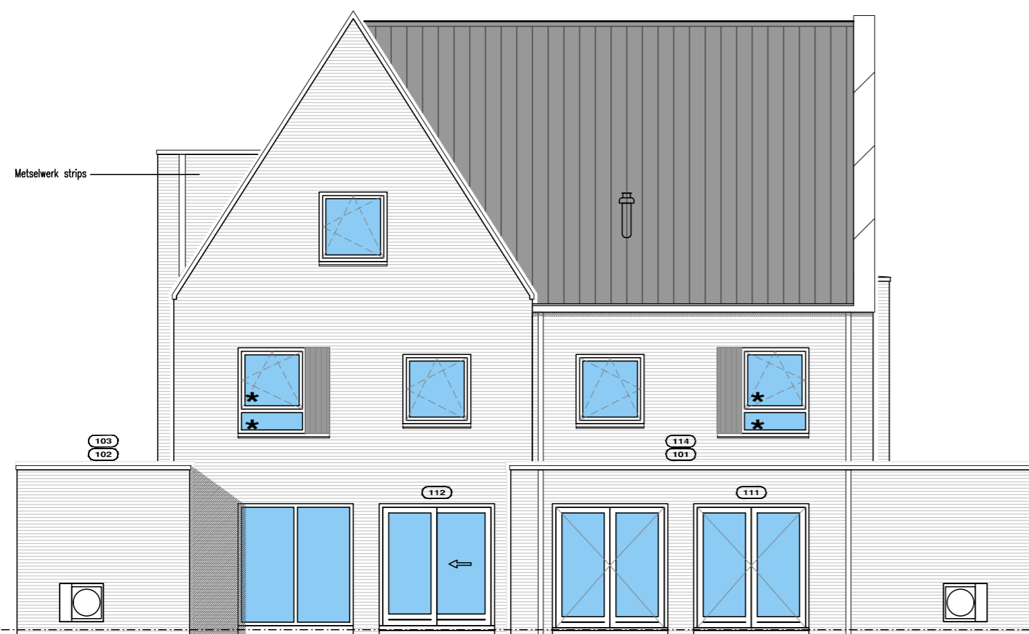
ACHTERGEVEL ★ Veiligheidsglas