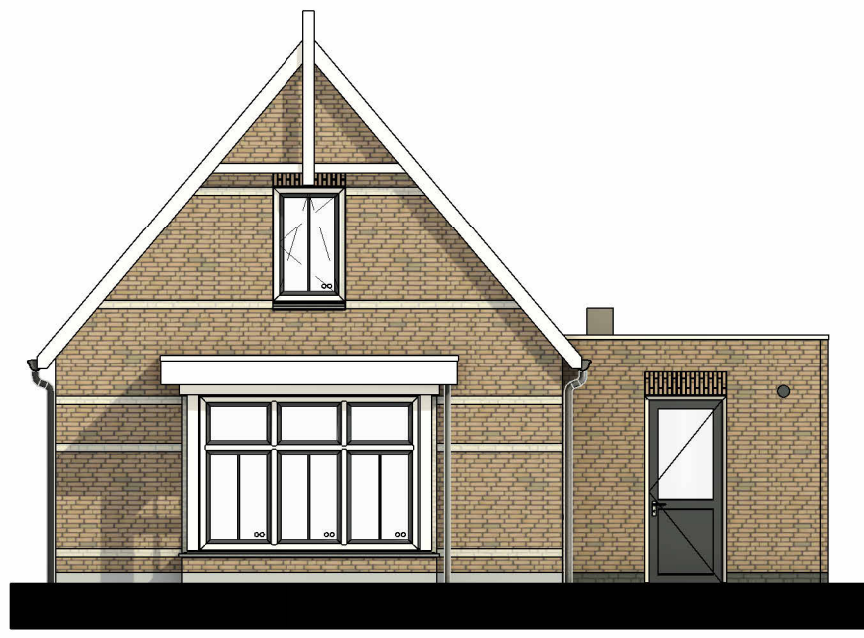
Voorgevel Bnr 19 Schaal: 1 : 100