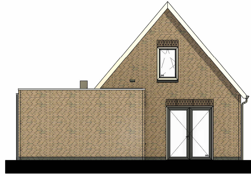
Achtergevel Bnr 19 Schaal: 1 : 100