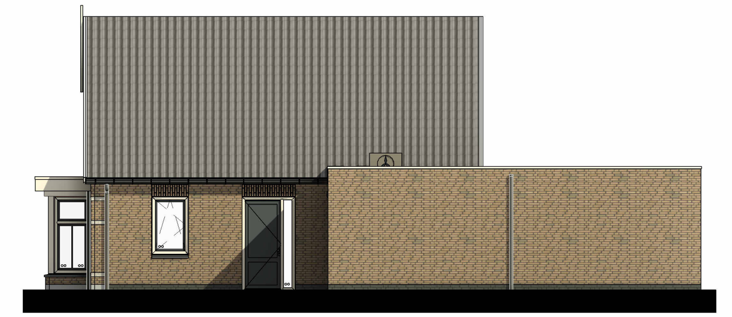
Rechter zijgevel Bnr 19 Schaal: 1 : 100