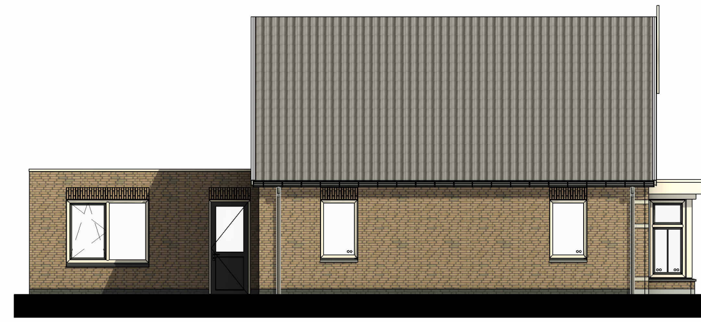
Linker zijgevel Bnr 19 Schaal: 1 : 100